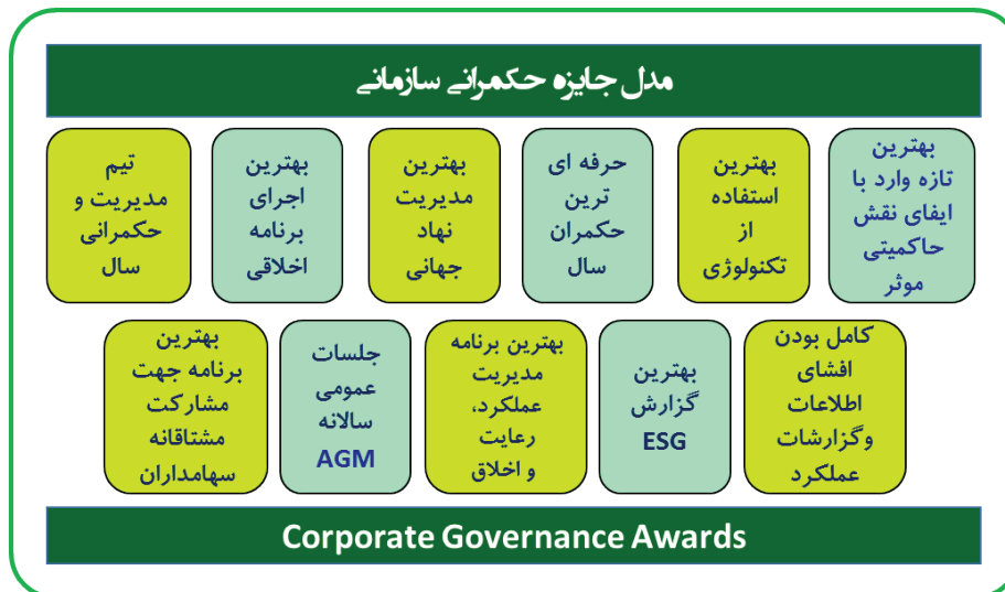
شکل ۴-۱ ابعاد و معیارهای مدل جایزه تعالی در حکمرانی سازمانی ویرایش ۲۰۱۹ در آمریکا

از جمله موضوعات مورد بحث که در جلسات عمومی سالیانه ۱ ، به ویژه ویرایش ۲۰۲۰ مدل تعالی و در بین مشاوران عمومی و تیم‌های حکمرانی سازمانی اعم از حضوری یا غیر حضوری، مجازی یا ترکیبی بیان شده است، این معیارهاست. این جلسات هم برای شرکت‌ها و هم برای سهامداران در خصوص موضوعاتی است که جنبه بررسی انجام تعهداتی شامل نظارت بر آموزش و آماده‌سازی مدیران ارشد و اعضای هیأت مدیره را دارد تا اطمینان حاصل شود که سهامداران فرصت تعاملی مناسبی در قبل و حین این جلسات را داشته و مصوبات اصلی را پیگیری و دنبال می‌کنند.